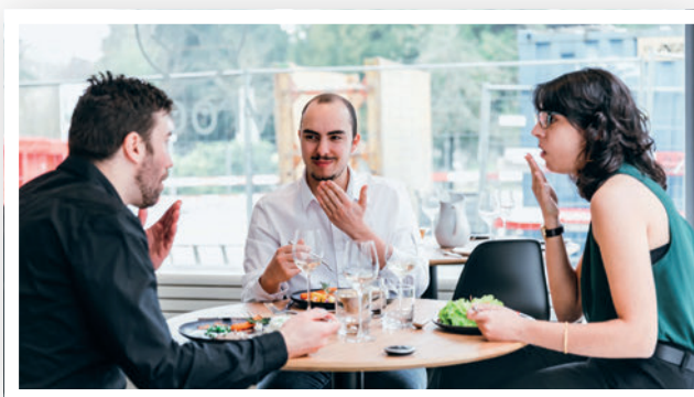
Le restaurant « Vroom » à Genève