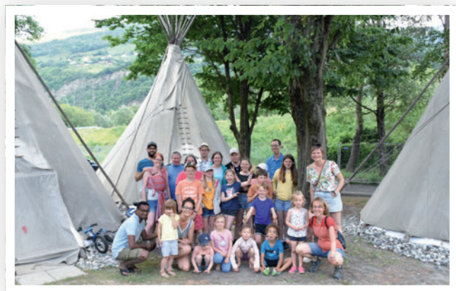
Week-end de camping à Sion

l'annonce de la surdité... Pour ces échanges, nous avons des habitués et des nouvelles familles, et sur les 5 rendez-vous de 2022, nous étions entre 4 et 8 familles représentées.