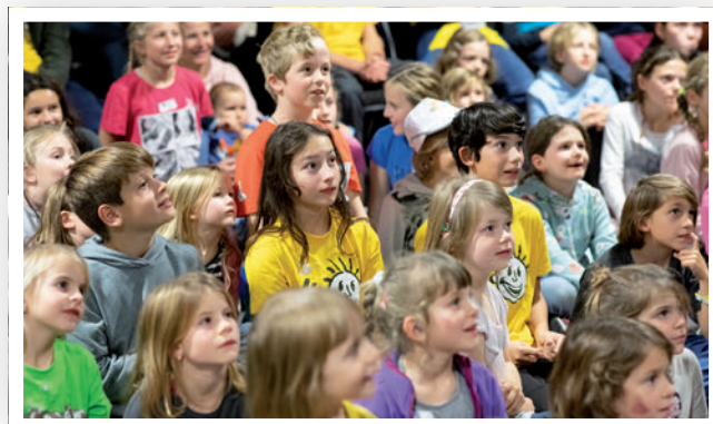
Au programme de la soirée du Congrès des parents 2022

En octobre, le Congrès national des parents s'est tenu pour la première fois à Wetzikon (ZH). Plus de 330 personnes ont trouvé le chemin de l'hôtel Swiss Star dans l'Oberland zurichois. Avec pas moins de 900 heures de travail bénévole, le comité d'organisation a mis sur pied un programme riche et varié pour toute la famille. Les enfants, les adolescents et leurs animateurs s'en sont donné à cœur joie avec