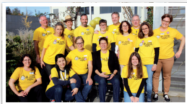
Congrès des parents 2022

En 2022, l'ASPEDA a une fois de plus fait le choix simple et maintenant éprouvé de la visioconférence pour la tenue de l'assemblée