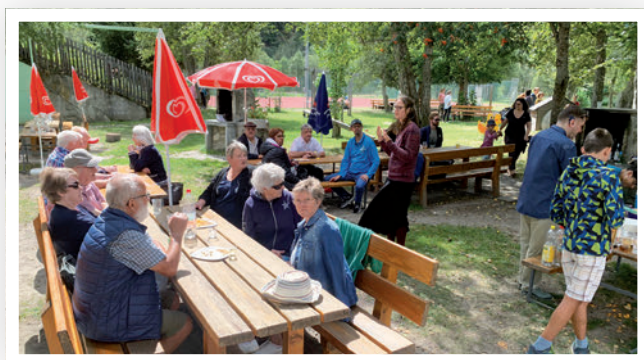
Activité d'été dans le district de Conches

En mai, nous avons tenu notre assemblée générale à Glis, suivie d'un savoureux dîner. Fin août, lors de notre activité d'été, nous nous sommes rendus à Münster dans le district de Conches où nous avons pu déguster un délicieux buffet de salades accompagné d'un plat froid. Juste à côté de notre espace barbecue, une magnifique place de jeu a ravi les enfants de tous âges. Fin novembre