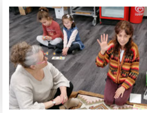
L'atelier ABC en langage parlé complété

Nous avons tenu notre assemblée générale au Château de Villa, à Sierre, le 13 mai 2022. En plus du comité, seules deux familles étaient présentes, soit 10 personnes au total.