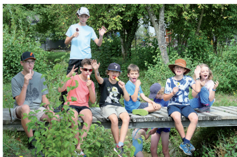
Randonnée aux abords du Lac de Wohlén