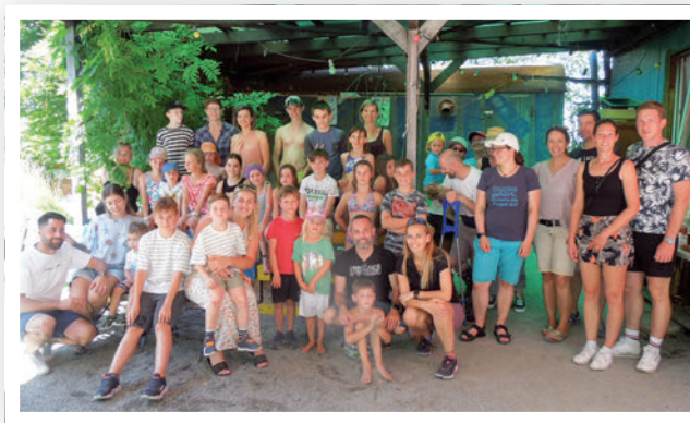
« Journée pizza des familles » à Schaan (FL)