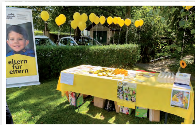
SVEHK-Stand in Zürich

An unseren Videokonferenzen nehmen jeweils 6 bis 8 Personen teil. Im Jahr 2021 haben wir festgestellt, wie ähnlich die Schwierigkeiten unserer Kinder sind und wie wichtig es ist, als Eltern mit anderen Eltern darüber zu sprechen. Sie können uns zuhören, ohne zu urteilen, und verstehen, worüber wir sprechen. Dieser Austausch per Zoom ist für alle Französischsprachigen offen!