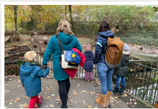
Im Basler Zolli