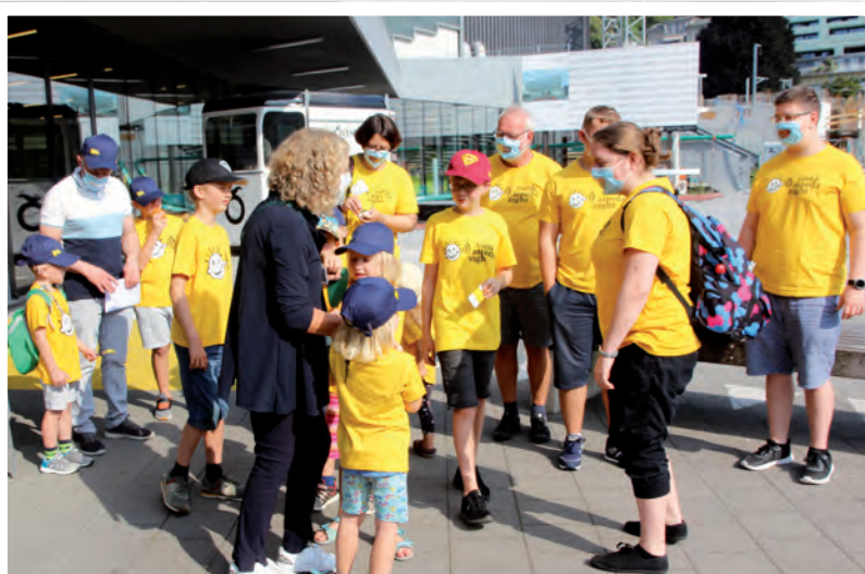
Familientag Deutschschweiz 2021