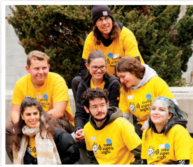
Kinderbetreuer:innen in Fiesch

Bereits zum dritten Mal fand der Familientag für die Westschweizer Familien Ende August im Park Pré-Vert in Signal de Bougy statt, dieses Mal mit einem Teilnehmerrekord von über 100 Personen. Während die Kinder und Jugendlichen im Seilpark oder die Kleineren auf dem Spielplatz unterwegs waren, konnten sich die Eltern am Vormittag zum Thema «Tipps und Tricks für den Alltag mit einem