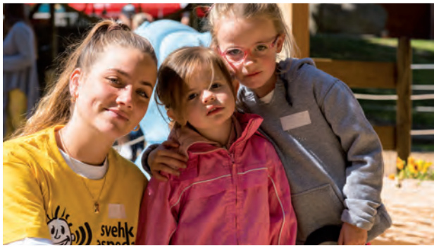
Am Kinderprogramm in Signal de Bougy

Mit viel Vertrauen und grossem Einsatz sind wir ins Jahr 2021 gestartet und konnten einige Anlässe auch planmässig durchführen. Das Networking mit unseren Stakeholdern und Vertreter:innen der Regionalgruppen haben wir virtuell durchgeführt, ebenso die Delegiertenversammlung im Frühjahr. Unsere Familientage im Sommer und die Elterntagung im Herbst fanden wieder ganz im Sinne der SVEHK vor Ort statt, was uns sehr freute.