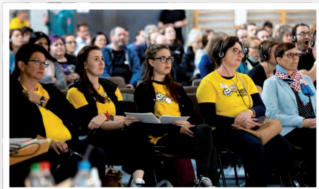
An der Elterntagung in Fiesch

Im August konnten wir endlich einen Anlass vor Ort durchführen. 28 Erwachsene und 20 Kinder trafen sich an einem wunderschönen Sommertag in Luzern im Verkehrshaus. Während die Vorstandsmit-